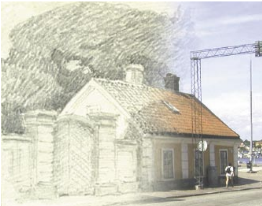
Fotomontage av Ferdinand Bobergs teckning tillsammans med en nutida bild av samma plats. Borgmästargatan, Karlskrona